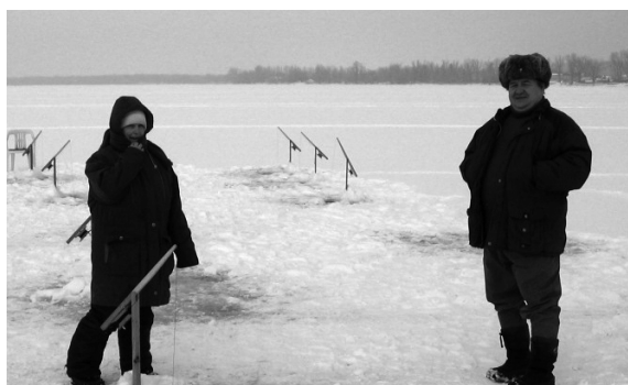
Couple habitant la falaise.

nombreux autres coups de téléphone, c'est Faune Québec Montérégie qui nous livrera quelques réponses. Une étude portant sur plusieurs spécimens de poissons pêchés l'été dernier dans la baie Missisquoi serait en cours. Les résultats de cette recherche, menée en collaboration avec les chercheurs de l'UQAM, ne sont