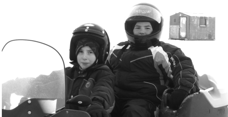
(sur l'air de Félix) «Attend-moé, ti-gars, tu vas tombé si j'suis pas là...»

nombreux autres coups de téléphone, c'est Faune Québec Montérégie qui nous livrera quelques réponses. Une étude portant sur plusieurs spécimens de poissons pêchés l'été dernier dans la baie Missisquoi serait en cours. Les résultats de cette recherche, menée en collaboration avec les chercheurs de l'UQAM, ne sont