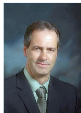
Réal Pelletier, maire

Municipal : Agrandissement du garage municipal, nouvelles règlementations (sécurité publique, urbanisme, collecte sélective, fosses septiques, politique de gestion contractuelle), amélioration du réseau d'aqueduc, amorce de la réfection de l'ancienne gare, et une gestion efficace des inondations du printemps 2011 qui a été une référence pour le gouvernement provincial dans l'élaboration de son plan d'action.